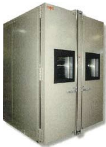
Рис. 1 Камера большого размера EWSH282-4CW производства ESPEC (TABAI) достигает максимальную скорость нагрева и охлаждения в 7°С/мин при максимальной нагрузке в 1 500 кг

Камера EWSH282-4CW (рис. 1) производства ESPEC (TABAI) с рабочим объемом 8 м 3 сконструирована для максимальной нагрузки на пол 1500 кг. Это означает, что одновременно можно испытать 18 модулей солнечных батарей размером до 1600x2100 мм. Оборудование позволяет обеспечить максимальные скорости охлаждения и нагрева до 7°С/мин. Эта впечатляющая скорость, которая несравнимо больше, чем у любой аналогичной камеры, достигается благодаря использованию проводниковых хромоникелевых нагревателей и каскадного охлаждения. Очевидным является то, что постоянно обеспечить эту скорость при функционировании камеры невозможно, но даже средняя скорость 3°С/мин является очень высокой для камер большого размера.