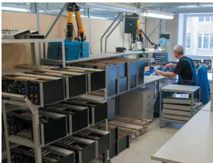
3 Участок сборки блоков