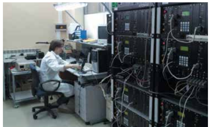
11 Стенды тестирования и технологического прогона продукции