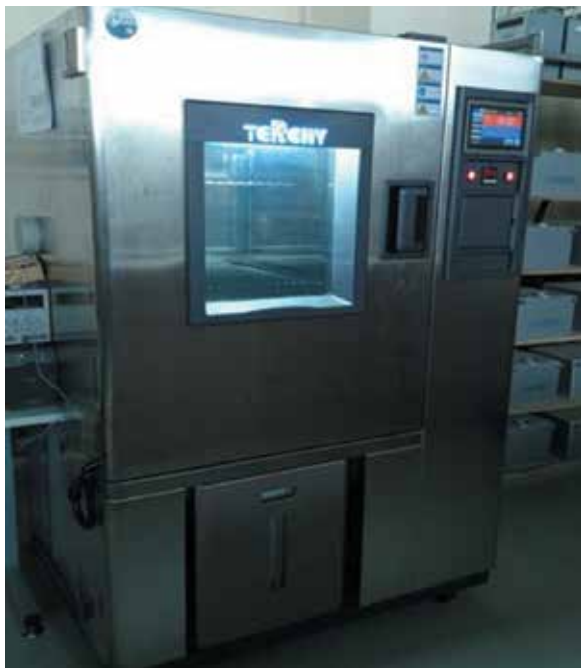
12 Климатическая камера TERCHY VYR-408CS