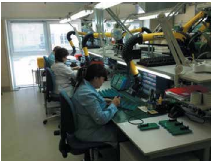
2 Участок ручного монтажа