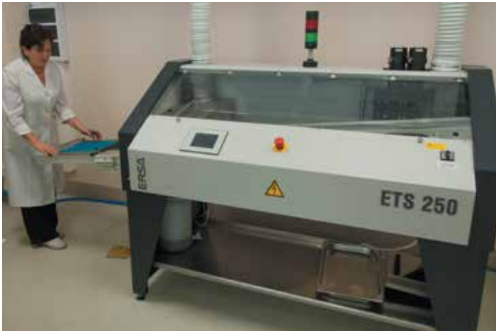
4 Установка пайки волной припоя ETS 250