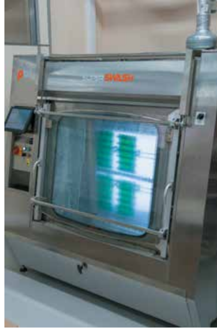
10 Участок промывки печатных узлов