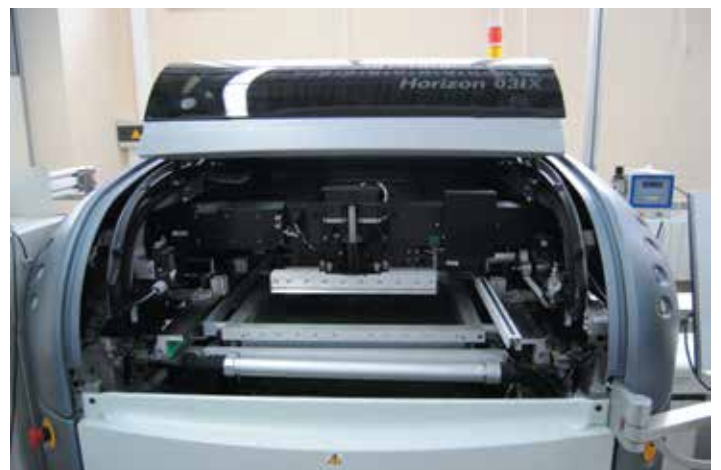
7 Установка трафаретной печати Horizon 03iX с системой Hawkeye и очисткой трафарета снизу