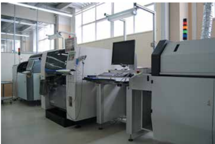
6 Автоматизированная линия поверхностного монтажа

компании, оказывается на практике очень полезной для недопущения дефектов поверхностного монтажа. Ведь большинства потенциальных дефектов, которые могут возникнуть именно на этапе нанесения пасты, удается избежать до установки компонентов именно благодаря системе Hawkeye. Мы спросили, насколько проблемной оказывается трафаретная печать с точки зрения возможных дефектов: «При грамотно спроектированном и качественно изготовленном трафарете, качественных непросроченных материалах и правильно выбранных режимах их нанесения проблем практически не возникает. Одним из важных условий качественного нанесения паяльной пасты является чистота трафарета: чем меньше шаг выводов компонентов, тем чаще следует протирать трафарет, и этого в большинстве случаев бывает достаточно. Следует заметить, что очистку трафарета Horizon 03iX производит в автоматическом режиме и не отвлекает персонал от выполнения основных задач».