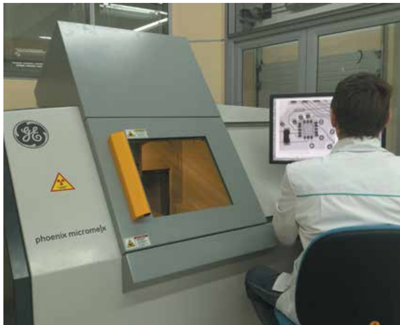
13 Система рентгеновского контроля Micromex DXR

упростило процедуру входного контроля и оптимизировало отладку технологических процессов под новые изделия.