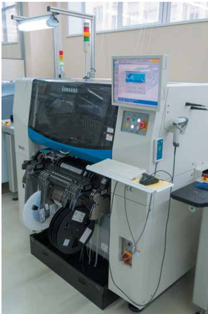
8 Автомат установки компонентов Samsung SM421

После нанесения пасты установка компонентов выполняется на автомате Samsung SM421. Бытует мнение, что для многих задач сборки возможности технологической линии с точки зрения гибкости и производительности в наибольшей степени раскрываются при реализации концепции с высокопроизводительным чип-шутером и специализированным автоматом установки более сложных компонентов. Тем не менее, специалисты компании Инфотэкс отметили, что универсальный автомат SM421 полностью удовлетворяет потребностям производства как в части гибкости и точности, так и в отношении производительности работы.