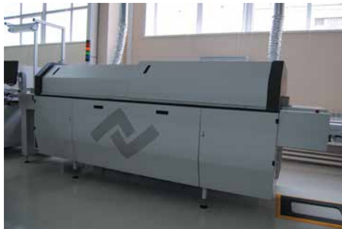
9 Конвекционная конвейерная печь ERSA Hotflow 2/12/08

Особый вклад в производительность вносит оснащение каждой головки установки компонентов камерой технического зрения, осуществляющей центрирование «на лету» компонентов практически всех распространенных типоразмеров: от чип-компонентов 01005 до микросхем 22x22 мм, что отвечает потребностям производства Инфотэкса. Важно также отметить возможность распознавания компонента не только по вы-