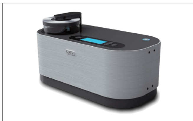
Установка магнетронного напыления

процессы технической и биологической деградации. Прибор может использовать практически любые методики освещения – темное и светлое поле, поляризованный свет, фазовый контраст и контраст Номарского, а также различные смешанные варианты. В некоторых конфигурациях можно получить увеличение до 10000x и проводить 3D-инспекцию в режиме реального времени. Для некоторых пользователей полезна функция записи видеороликов со звуковыми комментариями. Суммируя, можно сказать, что микроскоп Hirox – это универсальная исследовательская система, способная решать практически любые задачи визуального анализа в диапазоне оптического увеличения. Наиболее известные инсталляции в России – это Государственный Эрмитаж, Российский национальный исследовательский медицинский университет имени Н. И. Пирогова, крупные федеральные университеты, ведущие предприятия оборонной промышленности.