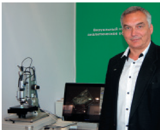
Видеомикроскоп высокого разрешения Hirox

Впервые в России на выставке "Аналитика Экспо 2018" компания "Остек-АртТул" представила настольный растровый электронный микроскоп (РЭМ) производства компании СОХЕМ (Южная Корея). Главное преимущество прибора в том, что его технические характеристики соответствуют полноразмерным напольным системам. Ключевой для РЭМ параметр – ускоряющее напряжение – в микроскопах СОХЕМ достигает 30 кВ, при этом шаг изменения составляет 1 кВ. За редким исключением, на рынке электронной микроскопии столь точными и полными функциональными характеристиками обладают лишь дорогие, напольные системы, тогда как настольные предлагают более скромные возможности. Высокое значение максимального ускоряющего напряжения позволяет не только получать высококонтрастное увеличенное (до 150000х) изображение, но и проводить надежный микроанализ в месте наблюдения с разрешением прибора – 5 нм. Микроскоп может работать практически со всеми широко известными зарекомендовавшими себя приборами для элементного микроанализа, такими как Oxford, EDAX, Bruker, Thermo.