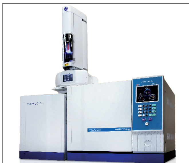
Хромато-масс-спектрометр YL Instruments

особенностей поверхностной структуры. Точность геометрии поверяется с помощью метрического эталона, поставляемого с системой. На 3D-реконструкциях можно измерять дистанции и углы, волнистость и шероховатость, проводить морфометрический анализ, использовать интерпретации 3D-моделей в виде каркаса, градиентов яркости, цвета или использовать виртуальный векторный осветитель для более точного анализа геометрии. Микроскоп обладает богатым функционалом для выполнения плоскостных измерений, в том числе с автоматизированным распознаванием границ и анализом статистики встречаемости однотипных объектов в кадре. Прецизионная автоматизация столика, с шагом перемещения 40 нм, позволяет выполнять точную 2D- и 3D-сшивку больших участков образца с высокой степенью детализации. Микроскоп способен выполнять интервальную съемку для визуализации течения медленных процессов, таких, например, как рост мелких живых объектов, усадка при остывании,