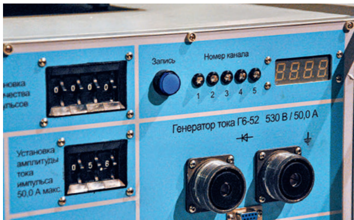
Фрагмент лицевой панели генератора Г6-52. В правой верхней части можно видеть линейку индикаторов, отображающих номер изделия, с которым в данный момент работает прибор

пробной катушки, но – и в этом наше ноу-хау – без необходимости намотки витков на эту катушку. Намотка – ручная операция, и ее исключение упрощает измерение и кратно уменьшает длительность всей операции. Про Ш1-23, который, по нашим сведениям, не имеет аналогов, можно без преувеличения сказать: он стал бестселлером.