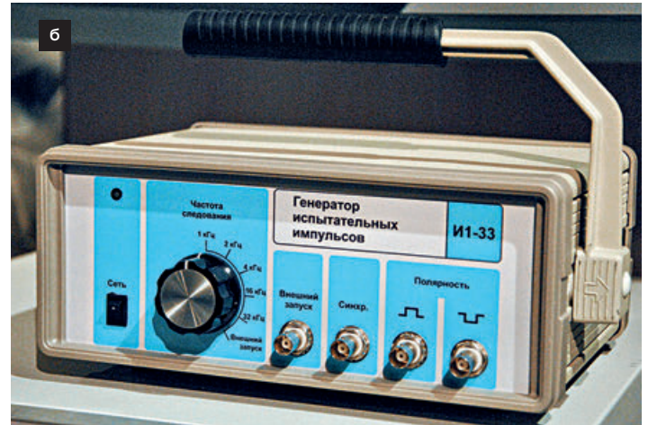
Разработано по собственной инициативе: а – измеритель параметров ферритовых сердечников кольцевой формы Ш1-23; б – генератор испытательных импульсов ИИ-33

пытали на них импортные супрессоры на соответствие требованиям их собственных ТУ. Ни один из них не выдержал тестирования! Сгорели все! А с супрессорами, изготовленными на этом заводе, всё в порядке. Производители улыбаются: видимо, перестарались. Ведь они начинали разработку, не имея таких средств измерения, и, получается, сделали конструкцию с запасом, который они оценивают как двукратный.