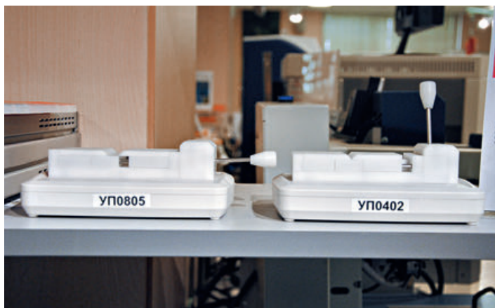
Адаптеры для рабочих мест измерения параметров компонентов

Как же проверить осциллограф? Стали искать – ничего подходящего нету. Пришлось взяться за дело