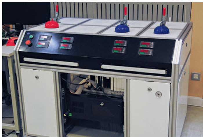
Система измерения электрических параметров ЭКБ под воздействием температуры «Терминал-Матрица»

Если уж заговорили о западных коллегах и эффективности... Общаясь с ними, мы имели возможность понять, как они добиваются высокой эффективности своего бизнеса. Не вдаваясь в детали, суть их подхода состоит в том, чтобы не делать ничего лишнего. Простой пример. В советские годы перед изготовлением единичного экземпляра чего угодно, хоть табуретки, на него выпускался полный комплект КД. Это никому не было нужно – табуретка все равно делалась «на коленке», но таково было требование ГОСТа. И этот стереотип до сих пор сохраняется у многих руково-